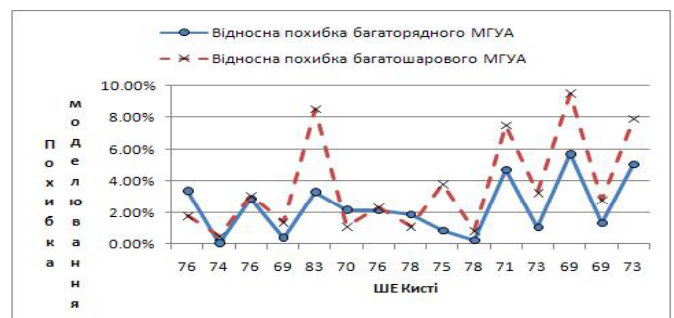
Рис. 2. Результати порівняння відносних похибок за одношаровим алгоритмом синтезу моделей та багатопаровим

На рис. 2 наведено порівняння результатів синтезу моделей за одношаровим та багатопаровим алгоритмами по їх відносних похибках.